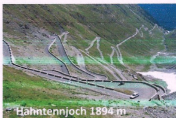
Hahntennjoch 1894 m