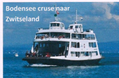
Bodensee cruse naar Zwitserland